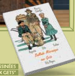
ALBUM DE BANDES DESSINÉES "BALLADE MÉCANIQUE AUX GETS"