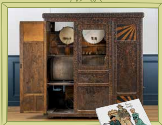
LE PIANO MÉCANIQUE DE PICASSO AVANT RESTAURATION.